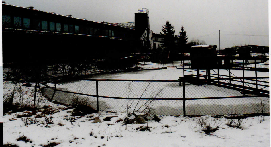
Jímka na kejdu