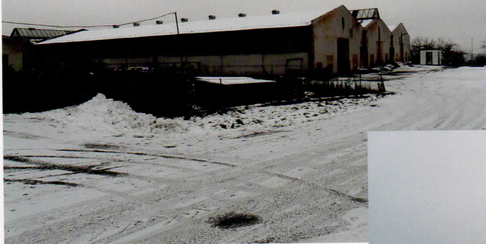
Původní stáje skotu.