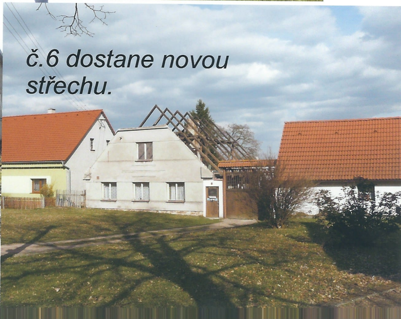
č. 6 dostane novou střechu.