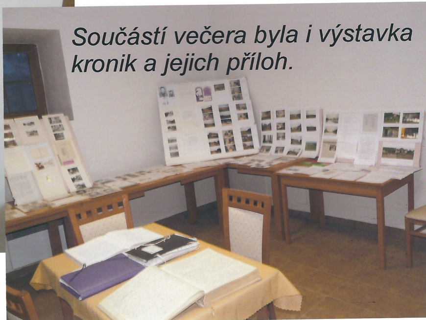
Součástí večera byla i výstavka kronik a jejich příloh.