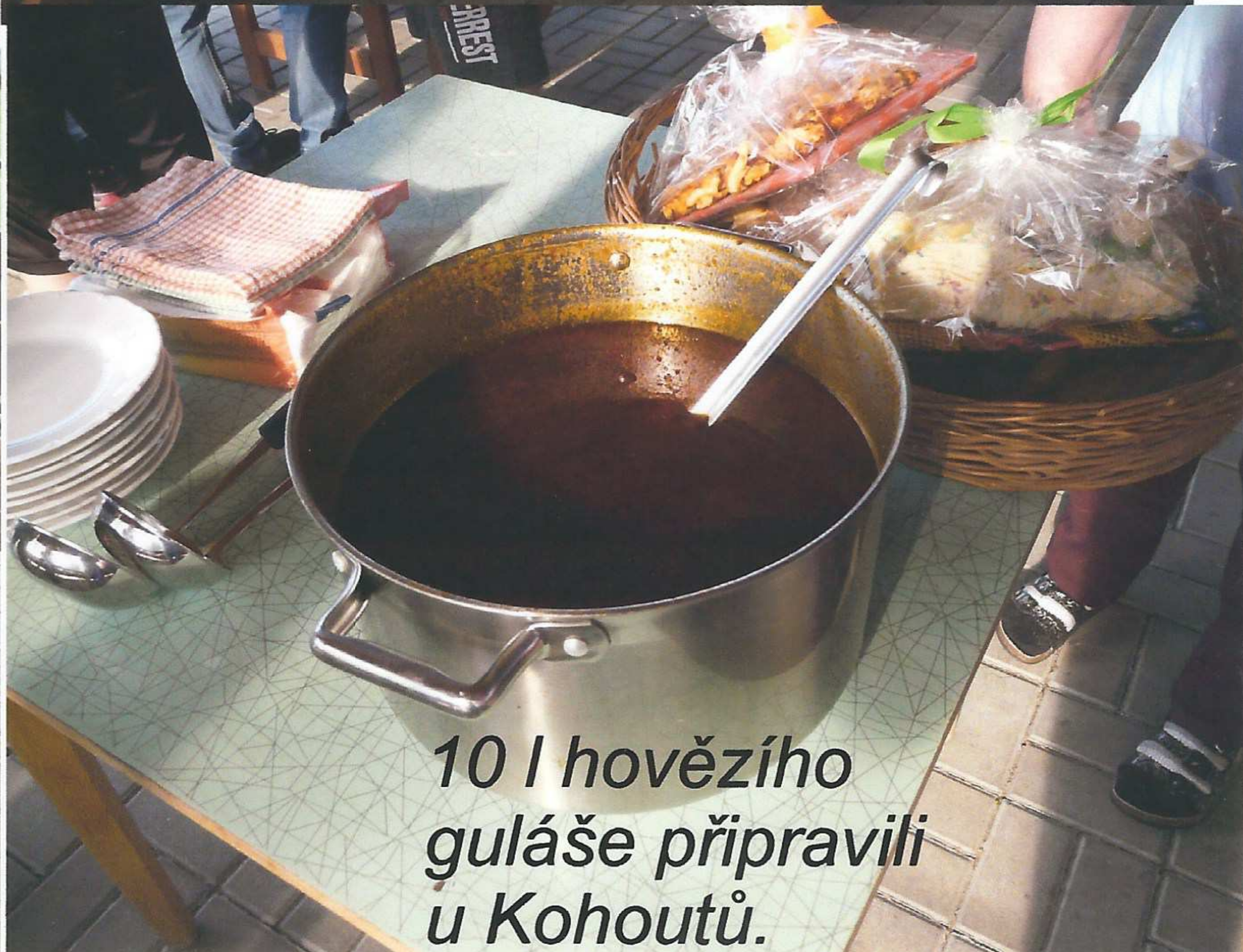
10 l hovězího guláše připravili u Kohoutů.