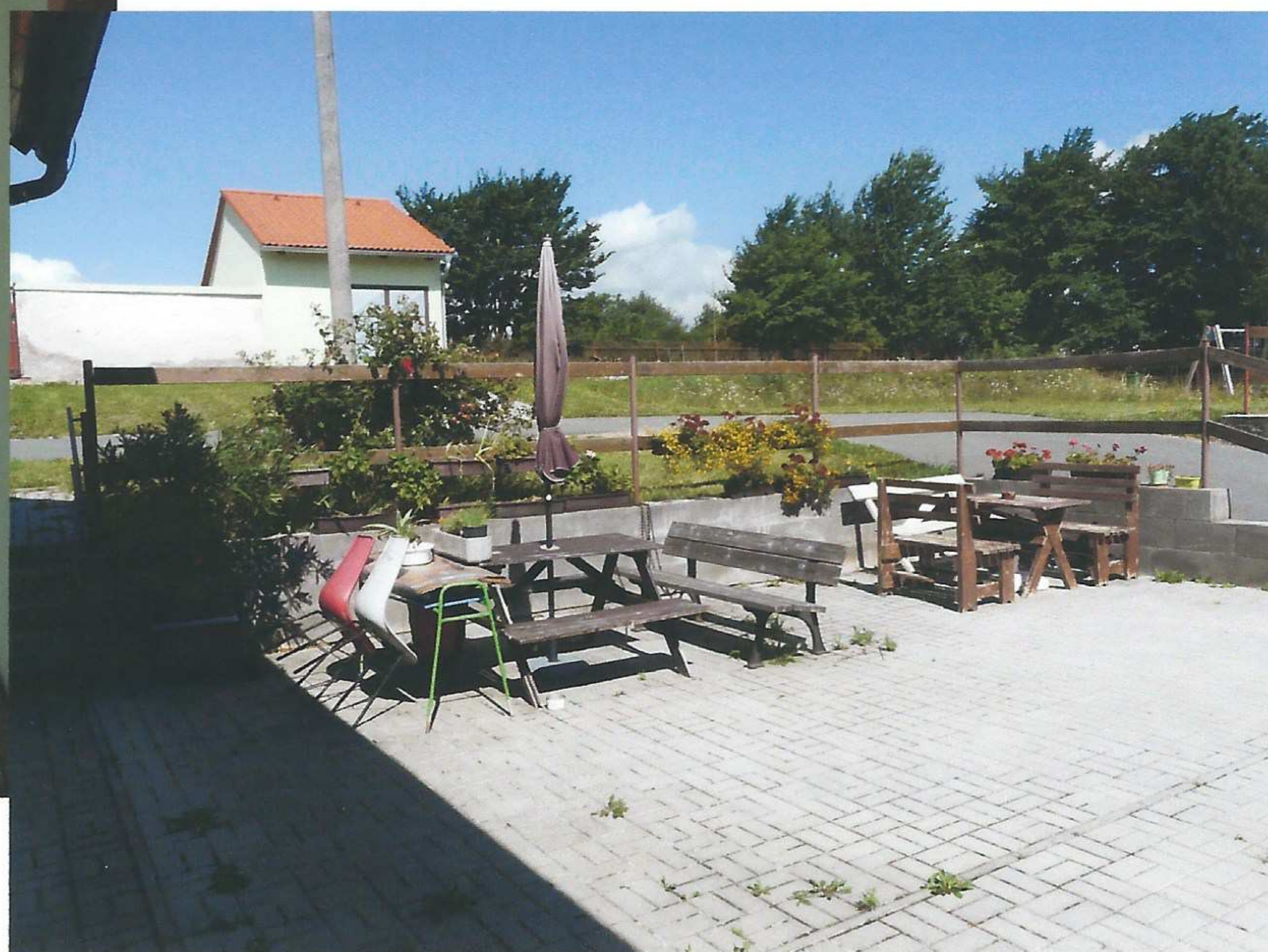
Pohled do dvora.