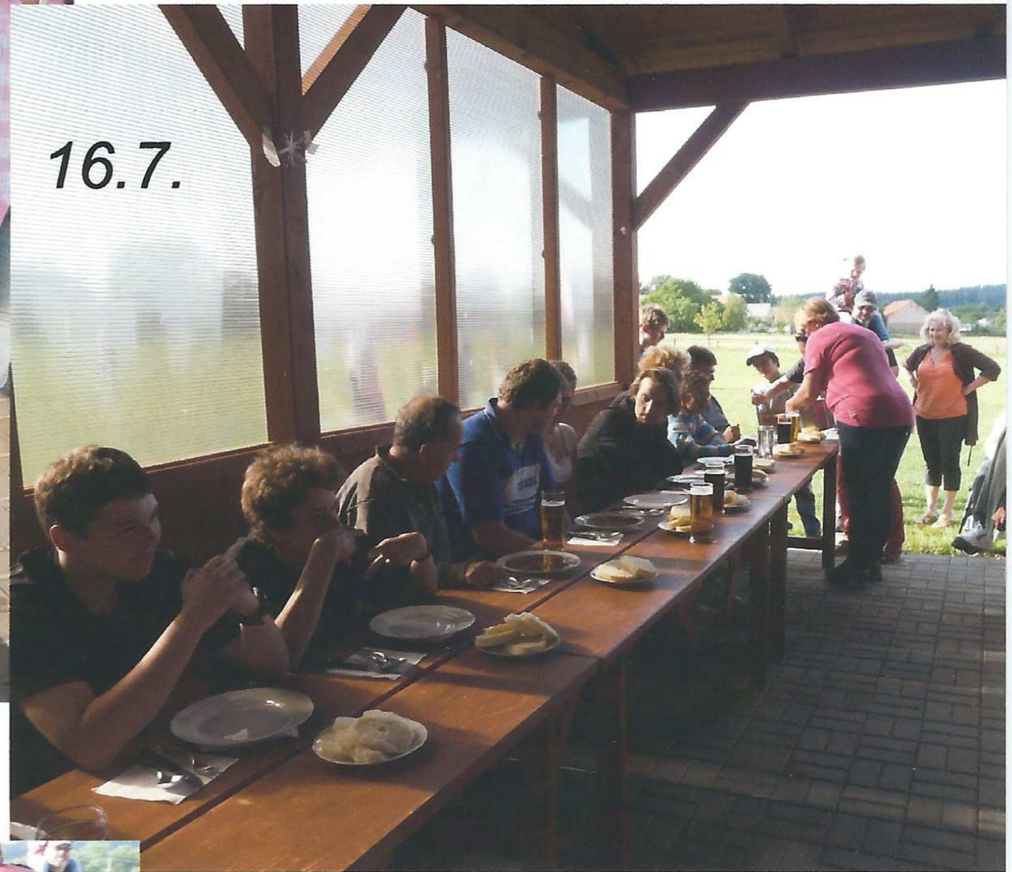
Rozhodovalo se mezi 11 účastníky...