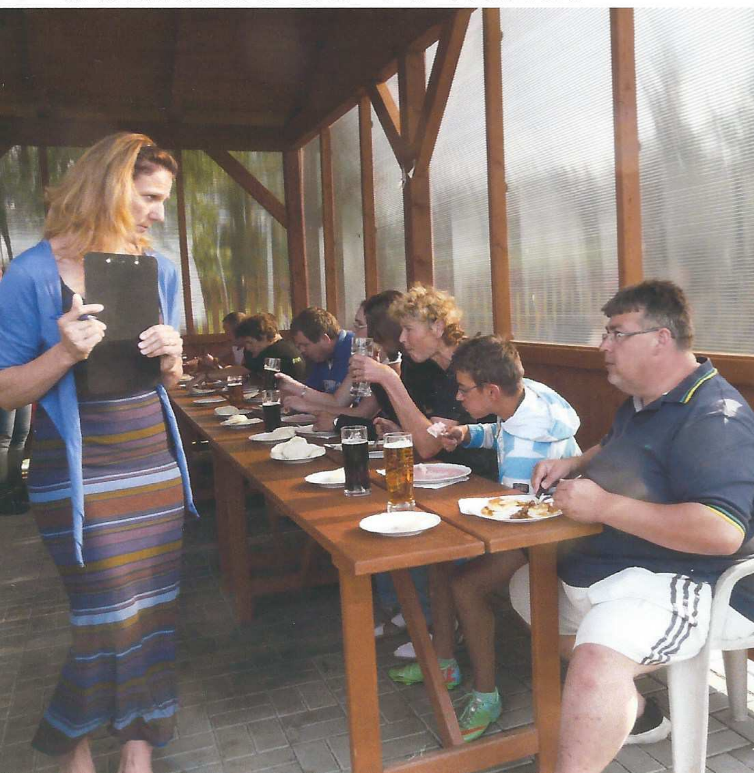
Soutěžilo se 15 minut