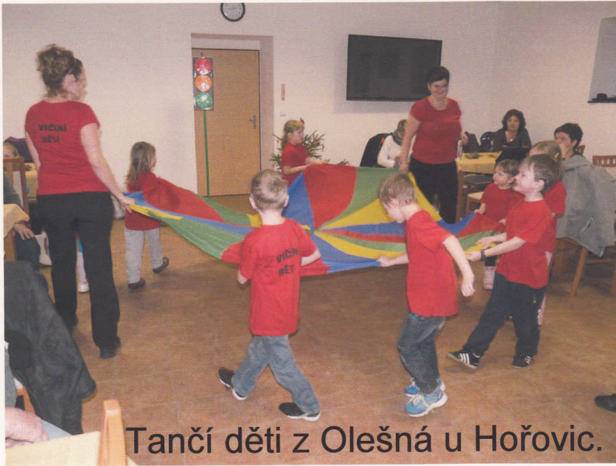
Tančí děti z Olešná u Hořovic.

6.12. v č.14 bylo připraveno odpoledne pro děti.