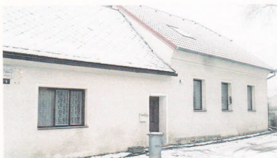
Dnes 8:13 - Rokycany

Stovka obyvatel Sire už několik dnů žije velkým kriminálním případem. Poprask v malé vesničce na Rokycansku vzbudilo policejní komando, které minulý pátek obsadilo nenápadný dům na návsi.