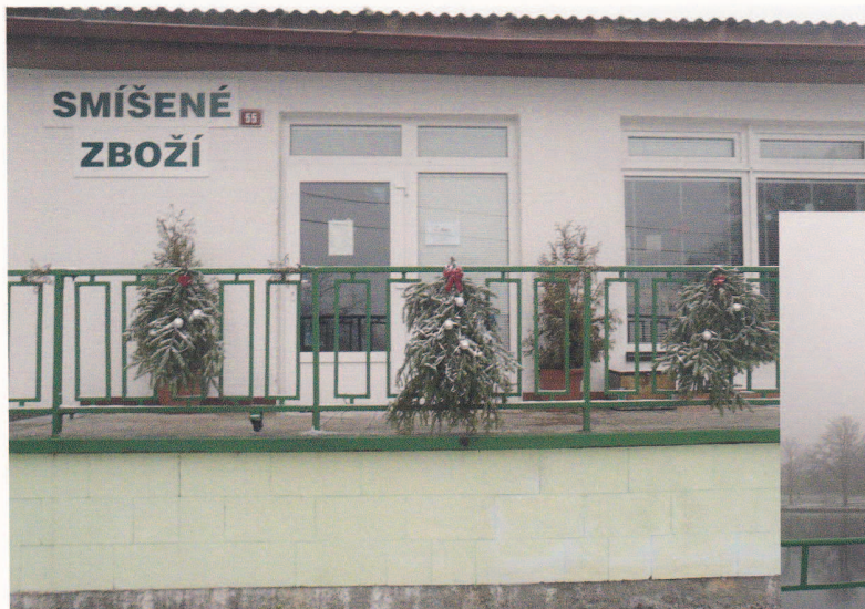
Nenápadný dům ve víscce na Rokycansku měl být továrnou na drogy – Novinky.cz Page 1 of 2